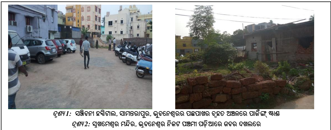
ଫିଗ୍ୟୁର 1: ସଞ୍ଜିବନୀ ହସିଙ୍ଗାଲ, ସାମନ୍ତରାପୁର, ଭୁବନେଶ୍ୱରର ପଛପାଖର ବୃହତ ଅଞ୍ଚଳରେ ପାକିଙ୍ଗ୍ କ୍ଷାତ୍ର ଫିଗ୍ୟୁର 2: ସ୍ୱାମିନେଶ୍ୱର ମନ୍ଦିର, ଭୁବନେଶ୍ୱର ନିକଟ ପଞ୍ଚମୀ ପଡ଼ିଆରେ ଜବର ଦଖଲରେ