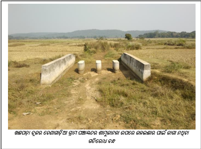
ଖଣ୍ଡପଡ଼ା ବ୍ଲକର ବେଣାଗାଡ଼ିଆ ଗ୍ରାମ ପଞ୍ଚାୟତର ଶାମୁକାନଳା ଉପରେ ଜଳଭଣ୍ଡାର ପାଇଁ ଜାଗା ନଥିବା ଗତିରୋଧ ବନ୍ଧ

ଉତ୍ତରଗୁଡ଼ିକ ଯୁକ୍ତିଯୁକ୍ତ ନଥିଲା କାରଣ ଚେକ୍ ଡ୍ୟାମ୍ ପାଇଁ ଜାଗା ଚୟନ ନିମନ୍ତେ ବୈଷୟିକ କାର୍ଯ୍ୟକର୍ତ୍ତାମାନଙ୍କୁ ଜଡ଼ିତ କରାଇବା ଏବଂ କୃଷକମାନଙ୍କର ଯୋଗଦାନ ସମ୍ପର୍କିତ ବିଭାଗୀୟ ନିର୍ଦ୍ଦେଶକୁ ଅନୁଯାଜନ ନ କରିବା ଫଳରେ ବାଞ୍ଛିତ ଲକ୍ଷ୍ୟ ହାସଲ ହୋଇପାରି ନଥିଲା । ଏହା ମଧ୍ୟ ଲକ୍ଷ୍ୟ କରାଯାଇଥିଲା ଯେ, 19 ଟି ମାମଲାରେ ଉପର କିମ୍ବା ନିମ୍ନ ଭାଗରେ ଚାଷ ଜମି