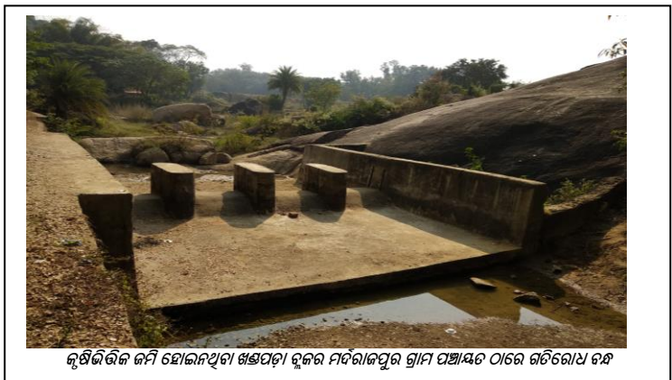
କୃଷିଭିତ୍ତିକ ଜମି ହୋଇନଥିବା ଖଣ୍ଡପଡ଼ା ବ୍ଲକର ମର୍ଦ୍ଦରାଜପୁର ଗ୍ରାମ ପଞ୍ଚାୟତ ଠାରେ ଗତିରୋଧ ବନ୍ଧ

ଏହିପରି ଭାବରେ, ଯୋଜନାଗତ ତୁଟି, ତୁଟିପୂର୍ଣ୍ଣ ଜାଗା ଚୟନ, ଭୁଲ୍ ନକ୍ସା ଏବଂ ଜାଗା ଚୟନ ପୂର୍ବରୁ କୃଷକମାନଙ୍କର ସଂପୃକ୍ତ ଅଭାବର ଫଳସ୍ୱରୂପ ଚେକ୍ ଡ୍ୟାମ୍ ଗୁଡ଼ିକ ଉପଯୋଗ ହୋଇପାରି ନଥିଲା, ଯାହାଫଳରେ 2.03 କୋଟି