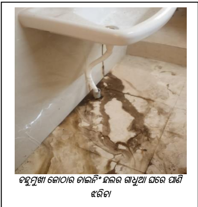
ବହୁମୁଖୀ କୋଠାର ଡାକନିଂ ହଲର ଗାଧୁଆ ଘରେ ପାଣି ଝରିବା