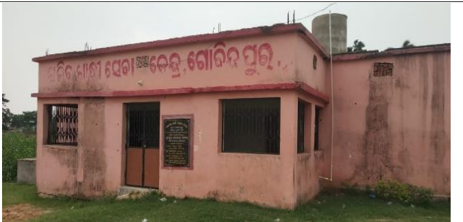
ଆଳି ପଞ୍ଚାୟତ ସମିତିର ଗୋବିନ୍ଦପୁର ଗ୍ରାମ ପଞ୍ଚାୟତର ଉପଯୋଗ ହୋଇନଥିବା ବିଏନ୍ଆରଜିଏସ୍‌କେ କୋଠାଘର

ଚାରୋଟି ପଞ୍ଚାୟତ ସମିତିରେ 77 ନଭେମ୍ବର 2011 ଠାରୁ ଜୁନ୍ 2013 ମଧ୍ୟରେ 85.70 ଲକ୍ଷ ଟଙ୍କା (ପରିଶିଷ୍ଟ 2.8.1) ବ୍ୟୟରେ ନଅଟି ବିଏନ୍ଆରଜିଏସ୍‌କେ କୋଠାବାଡ଼ିର ନିର୍ମାଣ କାର୍ଯ୍ୟ ସମ୍ପୂର୍ଣ୍ଣ ହେବା ଠାରୁ ଛଅ ରୁ ଆଠ ବର୍ଷରୁ ଅଧିକ ସମୟ ପର୍ଯ୍ୟନ୍ତ ବ୍ୟବହୃତ ନହୋଇ ରହିଥିଲା । ଗ୍ରାମ ପଞ୍ଚାୟତ କାର୍ଯ୍ୟାଳୟ ଠାରୁ ଏହା ଦୂରରେ ଥିବା ହେତୁ ମାର୍ଗାଢ଼ାଇ ପଞ୍ଚାୟତ ସମିତିରେ ନିର୍ମାଣ ହୋଇଥିବା ଦୁଇଟି ବିଏନ୍ଆରଜିଏସ୍‌କେ କୋଠା ବ୍ୟବହୃତ ହୋଇପାରି ନଥିଲା । ତିନୋଟି ପଞ୍ଚାୟତ ସମିତିରେ ଥିବା ଅବଶିଷ୍ଟ ସାତଟି କୋଠାବାଡ଼ି ଉପଯୋଗ ନ ହୋଇପାରିବାର କୌଣସି କାରଣ ପ୍ରଦାନ କରାଯାଇ ନଥିଲା ।