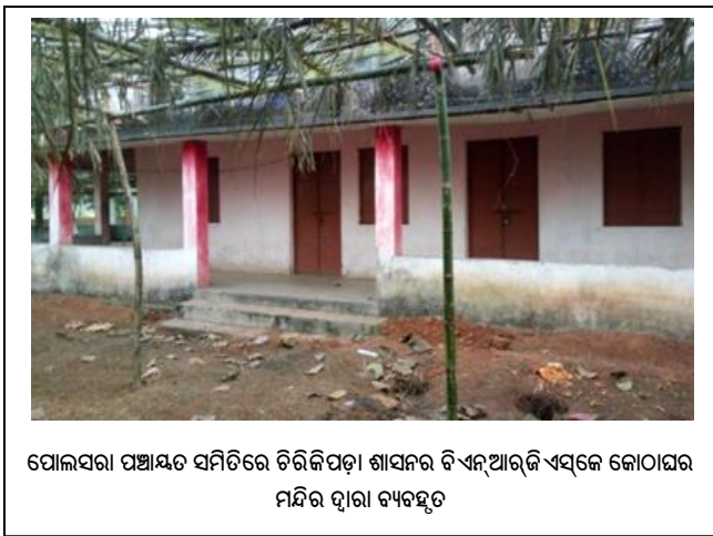
ପୋଲସରା ପଞ୍ଚାୟତ ସମିତିରେ ଚିରିକିପଡ଼ା ଶାସନର ବିଏନ୍ଆରଜିଏସ୍‌କେ କୋଠାଘର ମନ୍ଦିର ଦ୍ୱାରା ବ୍ୟବହୃତ

ମାଗିଆଇ ପୋଲିସ୍ କ୍ଷେତ୍ରର ଇନସ୍ପେକ୍ଟର ଇନ୍ ଚାର୍ଜଙ୍କ ଅନୁରୋଧ କ୍ରମେ କୋଠାଘର ଆବଶ୍ୟକ କରାଯାଇଥିବା କଥା ବିଡିଓ, ମାଗିଆଇ ବ୍ୟକ୍ତ କରିଥିବା (ସେପ୍ଟେମ୍ବର 2019) ବେଳେ, ଡେରାବିଶ ଏବଂ ଆଳିର ବିଡିଓ ମାନେ କୋଠାଗୁଡ଼ିକୁ ଅନୁଧିକୃତ ଦଖଲରୁ ମୁକ୍ତ କରିବା ନିମନ୍ତେ ପଦକ୍ଷେପ ଗ୍ରହଣ କରିବା ବିଷୟ ବ୍ୟକ୍ତ କରିଥିଲେ । ପୋଲସରା ବିଡିଓ ଅତିରକ୍ତ କୌଣସି