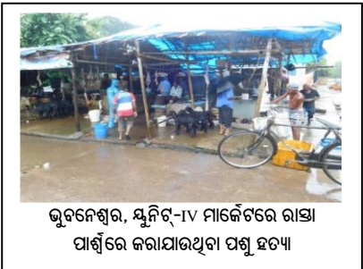
ଭୁବନେଶ୍ୱର, ଯୁନିଟ୍-IV ମାର୍କେଟରେ ରାସ୍ତା ପାର୍ଶ୍ୱରେ କରାଯାଉଥିବା ପଶୁ ହତ୍ୟା

ଉପରୋକ୍ତ ପରିପ୍ରେକ୍ଷାରେ, ଅଡିଟ୍ ଲକ୍ଷ୍ୟ କରିଥିଲେ ଯେ: