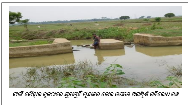
ଟାଙ୍ଗି ଚୌଦ୍ୱାର ବ୍ଲକରେ ସୁନାମୁହିଁ ମୁଣାଜର କୋର ଉପରେ ଅସମ୍ପୂର୍ଣ୍ଣ ଗତିରୋଧ ବନ୍ଧ

ଅତିବ୍ ମଧ୍ୟ ଦେଖିବାକୁ ପାଇଥିଲା 30.53 ଲକ୍ଷ ଟଙ୍କା ବ୍ୟୟ ହେଲା ପରେ 11 ଟି ଚେକ୍ ଡ୍ୟାମ୍ ସମ୍ପୂର୍ଣ୍ଣ ହେବାର ଧାର୍ଯ୍ୟ ତାରିଖ 75 ଠାରୁ 18 ରୁ 72 ମାସ ପର୍ଯ୍ୟନ୍ତ ଅସମ୍ପୂର୍ଣ୍ଣ ଅବସ୍ଥାରେ ପଡ଼ିରହିଥିଲା ( ପରିଶିଷ୍ଟ 2.7.2 ) । ଯଦିଓ ଅତିବ୍ କାର୍ଯ୍ୟ ସମ୍ପୂର୍ଣ୍ଣ ନ ହେବାର କୌଣସି ନଥିବୁକ୍ତ କାରଣ ପାଇନଥିଲେ, ସଂପୃକ୍ତ ବିଡିଓ ପ୍ରକଳ୍ପ କାର୍ଯ୍ୟର ସମୟାନୁଯାୟୀ ଅଗ୍ରଗତିକୁ ପର୍ଯ୍ୟବେକ୍ଷଣ କରିନଥିବା ଦେଖାଯାଇଥିଲା । ଫଳସ୍ୱରୂପ