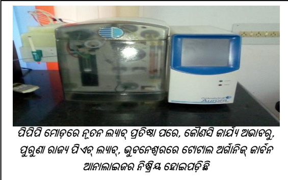
ପିପିପି ମୋଡ୍ରେ ନୂତନ ଲ୍ୟାବ୍ ପ୍ରତିଷ୍ଠା ପରେ, କୌଣସି କାର୍ଯ୍ୟ ଅଭାବରୁ, ପୁରୁଣା ରାଜ୍ୟ ପିଏଚ୍ ଲ୍ୟାବ୍, ଭୁବନେଶ୍ୱରରେ ଟୋଟାଲ୍ ଅଗାନ୍ତିକ୍ କାର୍ବନ ଆନାଲାଇଜର ନିଷ୍ପତ୍ତ ହୋଇପଡ଼ିଛି