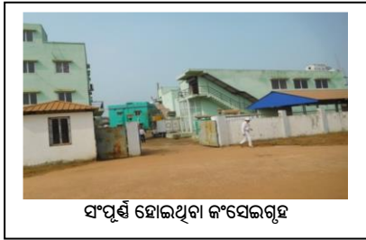
ସଂପୂର୍ଣ୍ଣ ହୋଇଥିବା କଂସେଇଗୃହ