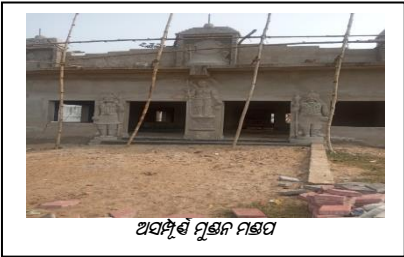
ଅସମ୍ପୂର୍ଣ୍ଣ ମୁଣ୍ଡନ ମଣ୍ଡପ